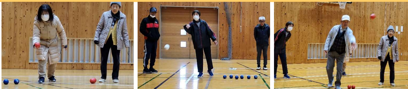
ボッチャ体験の様子