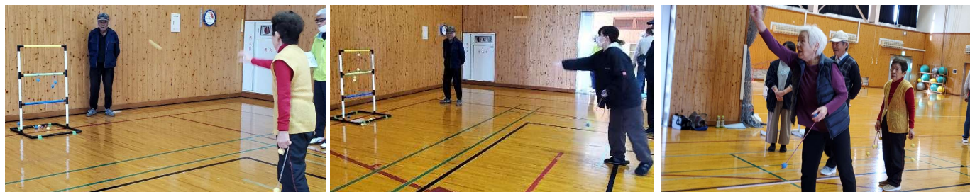
ラダーゲッターの様子

※3 モルックは、モルックと呼ばれる木の棒を投げて、スキttl(木製のピン)の倒れた合計得点が50点ぴったりに得点したチームが勝ちとなるゲームです。