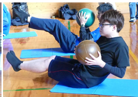
メディシンボールで腹斜筋を刺激

令和6年11月9日(土)、琴の浦クラブ主催の「令和6年度県民まるごとスポーツ推進事業:みんなdeユニスポ※」(県スポーツ協会補助事業)で「障がい者スポーツをやってみよう!」を琴の浦高等特別支援学校体育館で開催しました。